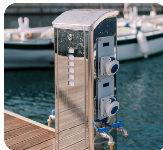
Coffret de distribution