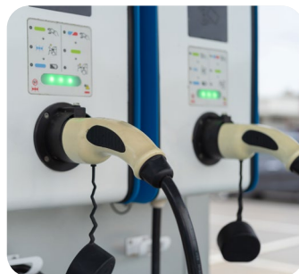
Borne de recharge VE